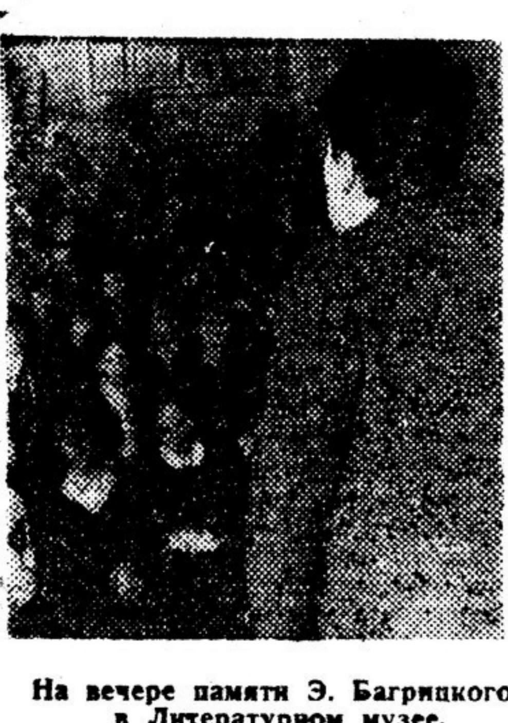
На вечере памяти Э. Багричко в Литературном музее.